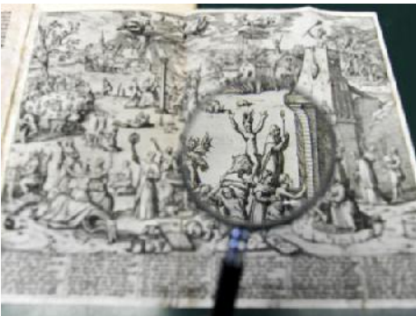
Dietrich Flade op weg naar zijn eigen executie