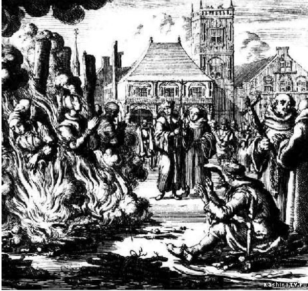
Heksenverbranding in Amsterdam in 1549

(door de bekende Nederlandse graveur Jan Luyken)