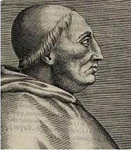
Innocentius VIII (heksenvervolger)